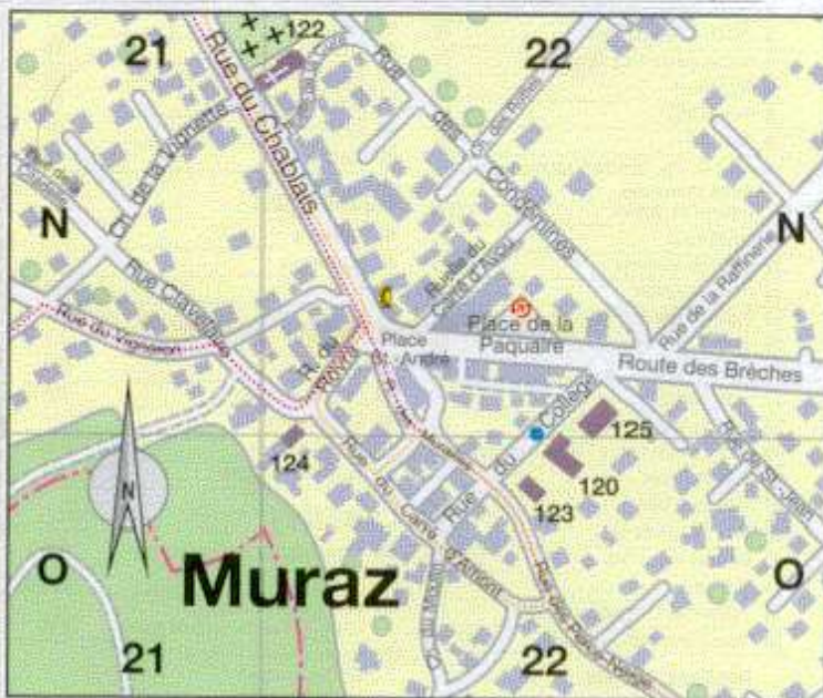
Extrait Plan de Région Monthey, Office du Tourisme 2004

Le blason de la Commune explicite l'étymologie de Collombey et Muraz. Il faut encore préciser la distinction d'autrefois entre Collombey-le-Petit et Collombey-le-Grand. Alors ajoutons qu'Illarsaz correspond à une « île brûlée » (arsus = brûlé, défriché par le feu) et Les Neyres, un lieu planté de noyers.